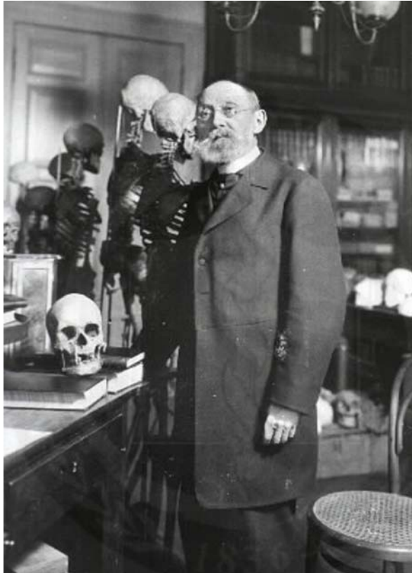
Abb. 3: Rudolf Virchow (1821-1902), Mediziner, Politiker, Prähistoriker, in seinem Arbeitszimmer