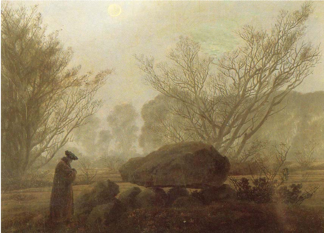
Abb. 1: Caspar David Friedrich malte mehrere Bilder mit Megalithgräbern, so das „Hünengrab am Meer“ und das „Hünengrab im Schnee“ (beide 1807) und den hier wiedergegebenen „Spaziergang in der Abenddämmerung“ (um 1830)

Diese Wiederentdeckung der Antike, die bald von Fürsten und Adligen auf das Bildungsbürgertum und Diplomaten aus den West- und Mitteleuropäischen Staaten übergehen sollte, führte zu einer „Antikensehnsucht“ und einer humanistischen Idealisierung der Antike als Vorbild für das eigene Zeitalter.