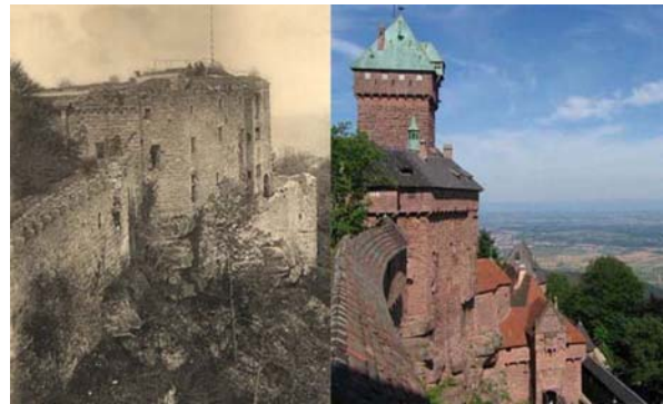
Abb. 5: Die Hohkönigsburg bei Sélestat vor und nach dem wilhelminischen Wiederaufbau

Dennoch blieb im Vergleich zu Frankreich und Großbritannien die naturwissenschaftlich-erdgeschichtliche Betrachtung der Menschheitsgeschichte in Deutschland von untergeordneter Bedeutung, denn der