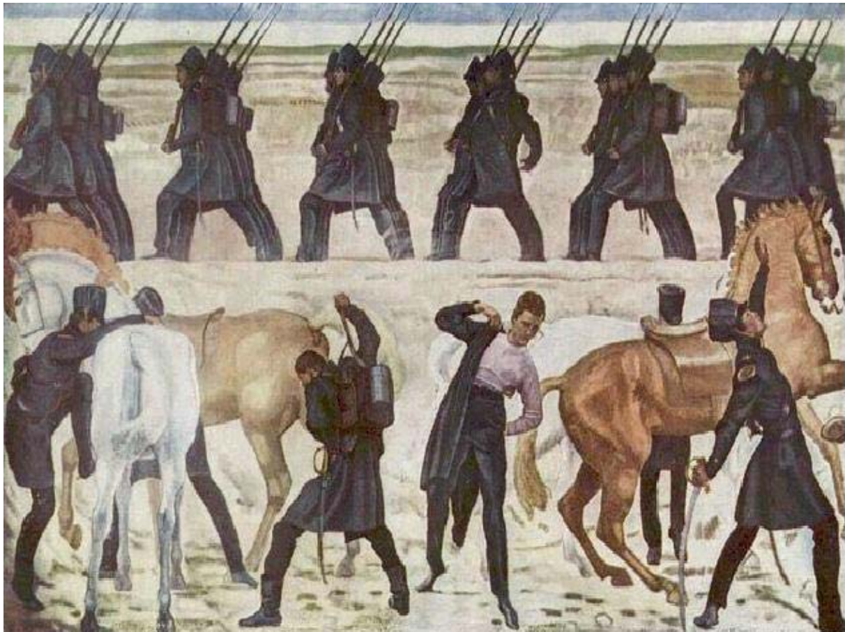
Abb. 7: „Der Auszug deutscher Studenten in den Freiheitskrieg 1813“, Gemälde von Ferdinand Hodler in der Aula der Universität Jena (1909)

Die kulturhistorische Tradition der Archäologie war nicht auf Deutschland beschränkt. Hier erfuhr sie durch Kossinna jedoch eine extrem nationalistische Ausprägung. Im Verlauf von Kossinnas Arbeit lässt sich erkennen, dass mit der Erforschung von Siedlungsgebieten auch aktuelle Gebietsansprüche verbunden waren. Begünstigt durch die konservative Entwicklung des Kaiserreichs (Langewiesche 2000, 209ff.) wurden das ethnische und nationalistische Denken gestärkt und Traditionslinien konstruiert von den Deutschen über die Germanen bis in die Steinzeit hinein: „Die Welle der nationalen Begeisterung nach der Gründung des Deutschen Kaiserreiches und die davon ausgelöste Besinnung auf nationale Wurzeln begünstigte“ die Vorstellung von der „Einheit von Volk, Territorium, Sprache und Kultur“ einer Nation (Grünert 2002, 71). So postulierte Kossinna, die „Deutsche Archäologie“ sei „eine hervorragend nationale Wissenschaft“ – so der Titel seiner im Jahr 1912 erschienenen Schrift (Kossinna 1912). Es war die Zeit der geistigen Mobilmachung vor dem ersten Weltkrieg (Flasch 2000) wie sie auch in der Instrumentalisierung der sogenannten Befreiungskriege für den deutschen Nationalismus sichtbar wird; Beispiele sind neben dem Leipziger