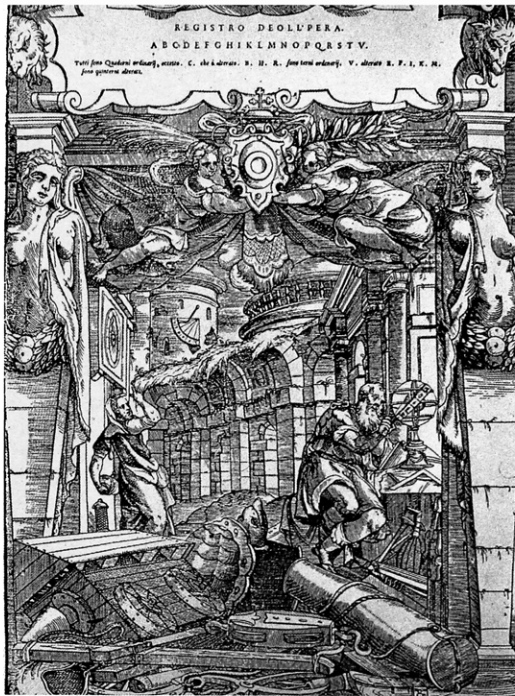
Abb. 5. Daniele Barbaro (?), Ursprüngliches Frontispiz zur Vitruvedition von 1556, Holzschnitt

Barbaros Vitruvedition aus dem Jahre 1556. 18 Für diese Ausgabe existieren zwei »konkurrierende Titelblätter«, eines (Abb. 5) wohl von Barbaro selbst entworfen, das andere von Andrea Palladio. 19 Das zweite, auch für die weiteren Auflagen verwendete Frontispiz in Form eines antikisierenden Triumphbogens zeigt Personifikationen der für die Architektur grundlegenden »artes«, Arithmetik, Musik, Geometrie, Disegno, Perspektive und Astronomie. Interessanter als dieses eher konventionelle Titelblatt erscheint mir die ursprüngliche Illustration, die für Barbaro offenbar wichtig genug war, um sie in die Edition von 1556 zusätzlich zum konventionelleren Fron-