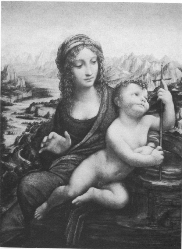
Abb. 5: Leonardo und Werkstatt (?), Madonna mit der Spindel , 1501–1507 (?), Öl auf Holz, 50,2 x 36,4 cm, New York, Privatsammlung

suggerieren die Felsen in Leonardos Gemälde eine Gegend deutlich oberhalb der Baumgrenze, einen Ort also, an dem Laubbäume normalerweise überhaupt nicht mehr gedeihen oder zumindest nicht in dieser Größe. Wenn Leonardo nun im unfruchtbaren Gelände des Hochgebirges trotzdem einen grünenden Baum darstellt, dann verweist er hier vermutlich auf Maria als die zunächst Unfruchtbare und dann spät und vom Menschen unberührt Gebärende. Der Gegensatz von Baum und Hochgebirge verdankt sich also ebenfalls einer religiösen Symbolik, mit der Marias anfängliche irdische Unfruchtbarkeit und ihre unbefleckte Empfängnis zum Ausdruck gebracht werden.