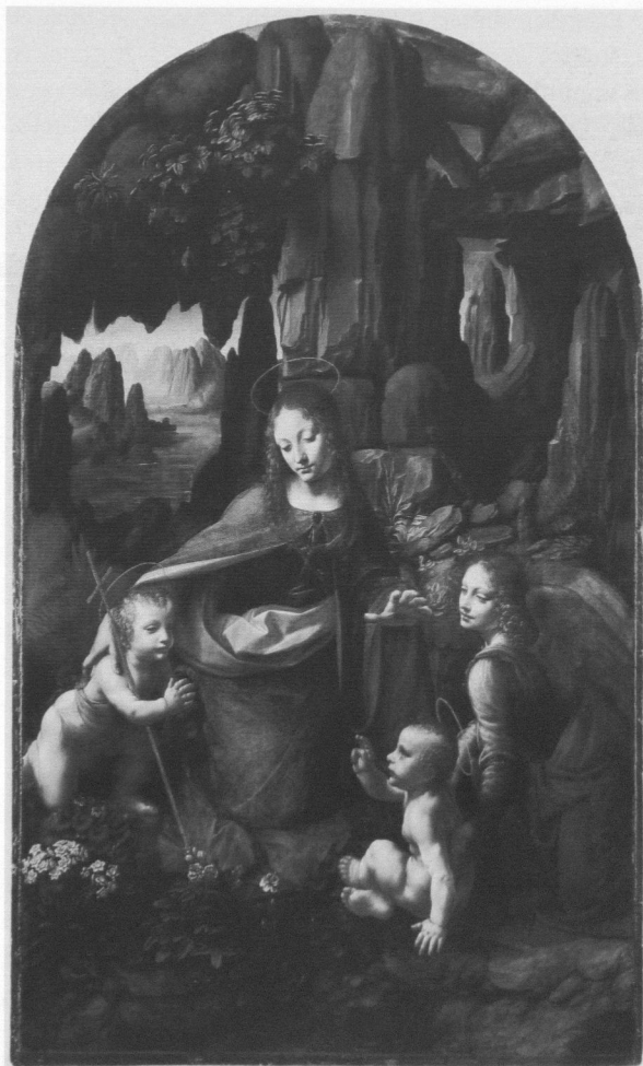
Abb. 3: Leonardo und Werkstatt, Felsgrottenmadonna , 1495–1499 und 1506–1508, Öl auf Holz, 189,5 x 120 cm, London, National Gallery of Art

Version der Felsgrottenmadonna (Abb. 3) dehnt sich die Wasserfläche deutlich zu erheblicher Größe aus, so dass man hier trotz des hoch gelegenen Ortes von einem Meer sprechen kann. Auch hiermit könnte eine Anspielung auf marianische Symbolik intendiert gewesen sein: Den Namen »Maria« leiteten ältere Exegeten vom lateinischen Wort für Meer, »Mare«, ab, und so wie alle Flüsse in das Meer münden, so münde auch die göttliche Gnade in Maria. In ähnlicher Weise könnte man in Anlehnung an patristische und zeitgenössische franziskanische Schriften den vor Maria sich öffnenden Abgrund deuten: Dieser Abgrund, lateinisch »abyssus«, wurde als die nicht-penetrierbare Tiefe des vorzeitlichen Ur-Ozeans verstanden, von dem alles Wasser kommt und in den alles Wasser zurückkehrt. 14