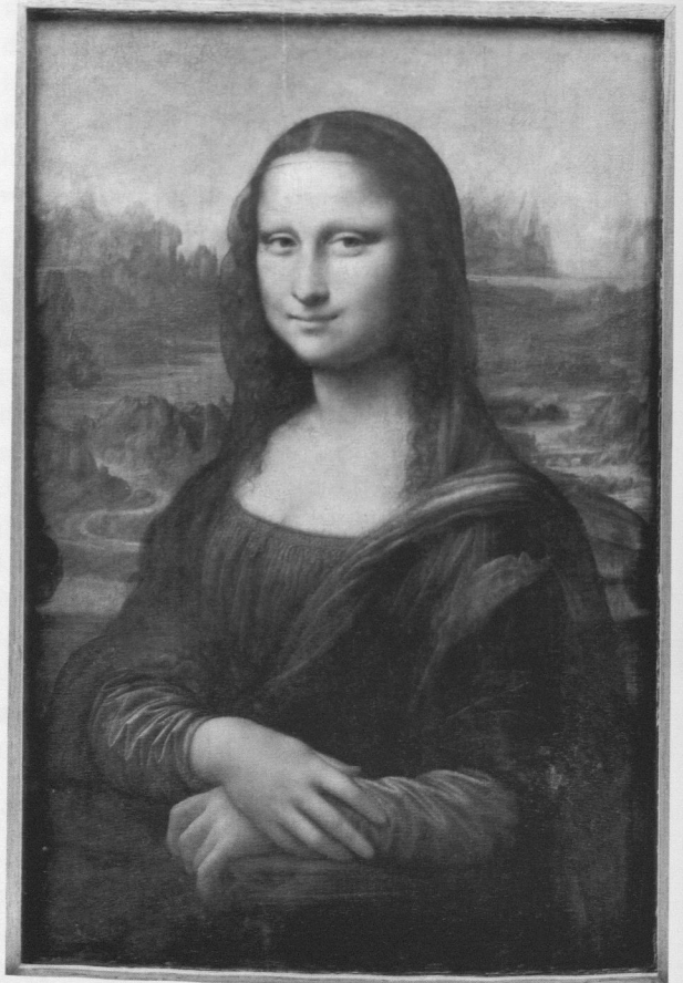
Abb. 6: Leonardo, Porträt der Lisa del Giocondo , 1503–1506 und 1510 (?), Öl auf Holz, 77 x 53 cm, Paris, Louvre

Im Porträt der Lisa del Giocondo ist allerdings nicht nur der Landschaftshintergrund bemerkenswert, sondern ebenso die Verwandtschaft der formalen Bildgestalt mit Madonnendarstellungen. Tatsächlich finden sich zahlreiche Elemente bereits in den Andachtsbildern mit Maria und dem Christuskind: Lisa thront ebenso wie die Madonna hoch über einer Landschaft; diese Landschaft weist oft Felsen auf; ebenso finden sich weitere Elemente wie zum Beispiel Wege, Brücken oder Flüsse, die wiederum in den marianischen Bittgesängen als schmückende Beiwörter Mariens auftauchen. Die formale Verwandtschaft des Porträts der Lisa del Giocondo mit Madonnendarstellungen ist also nicht von der Hand zu weisen, was im Übrigen auch für andere Frauenporträts der Renaissance gilt. 41 Dieses Phänomen erklärt sich dadurch, dass die Mutter Gottes als