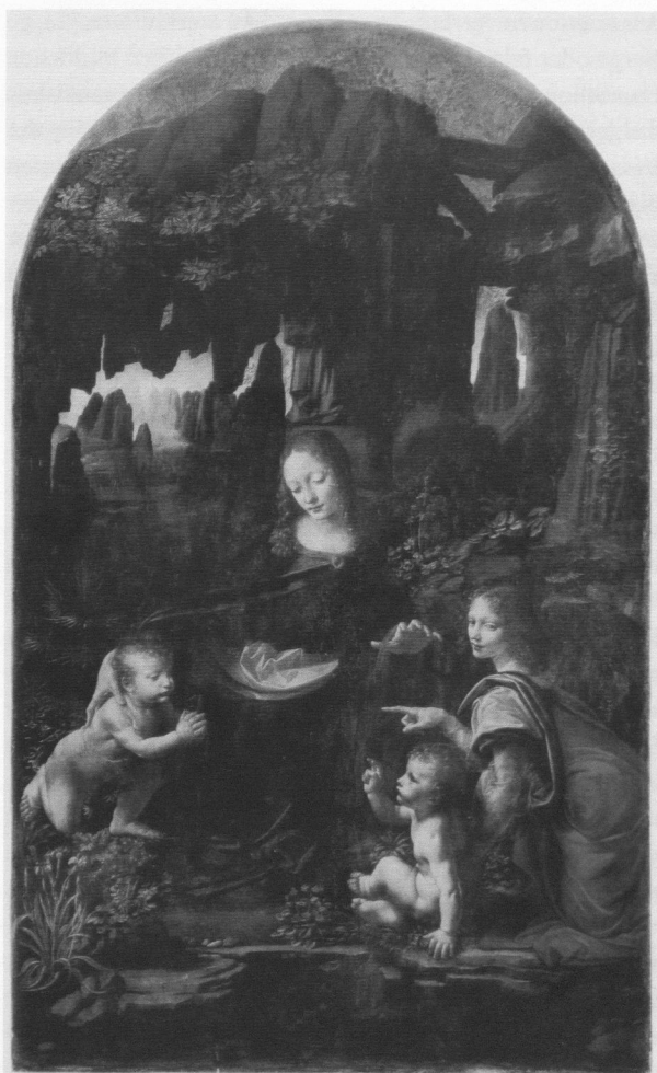
Abb. 2: Leonardo, Felsgrottenmadonna , 1483–1484, Öl auf Holz, auf Leinwand übertragen, 197,3 x 120 cm, Paris, Louvre