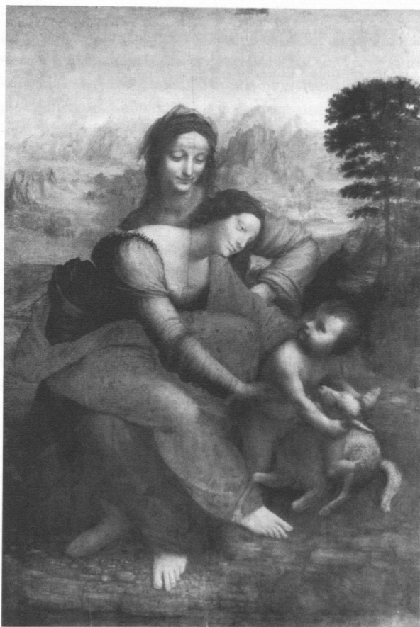
Abb. 4: Leonardo, Anna Selbdritt , ca. 1502–1513 (?), Öl auf Holz, 168,5 x 130 cm, Paris, Louvre

An anderer Stelle fährt er fort: »Der Körper der Erde ist wie der Körper der lebenden Wesen von den Verzwei-