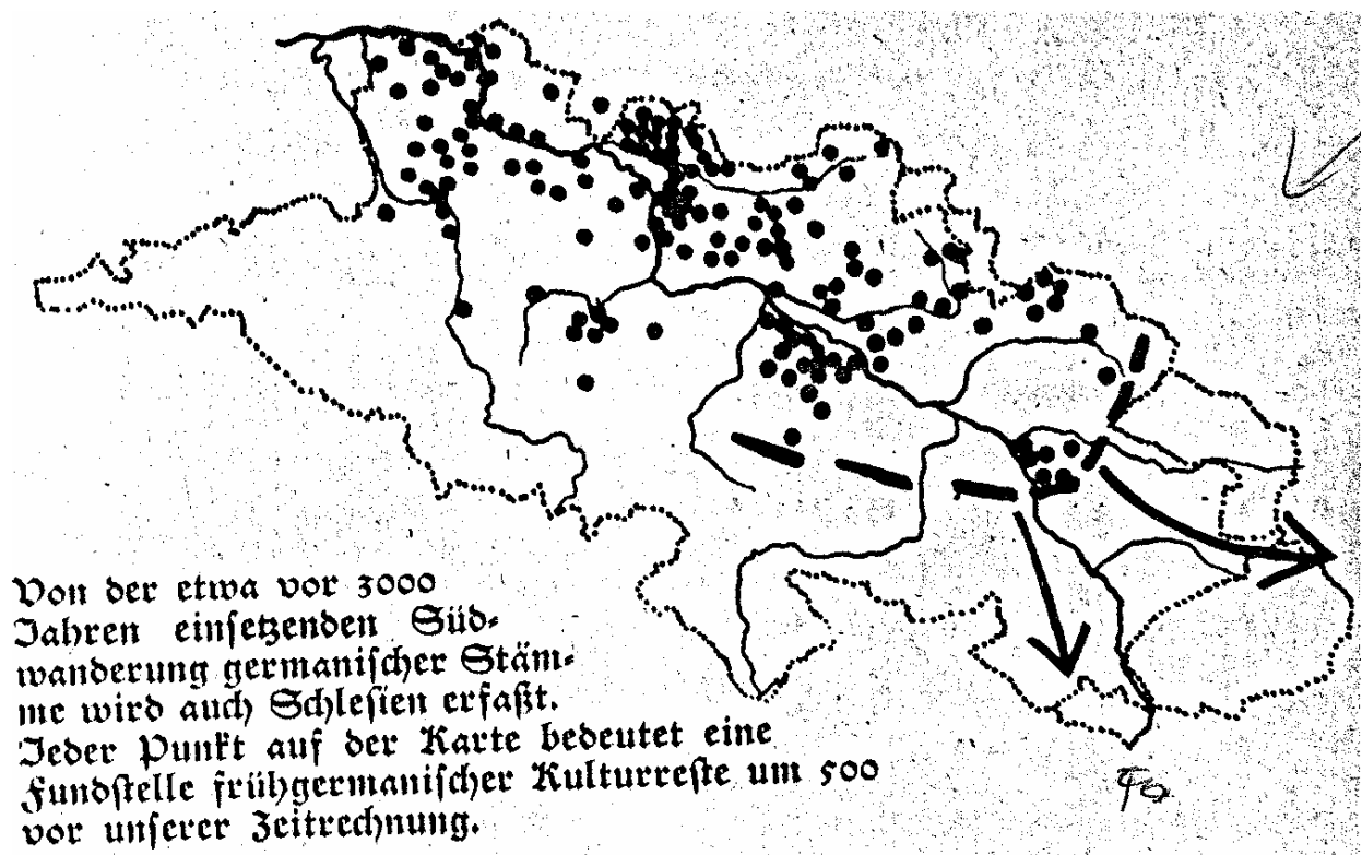
Abb. 6: Stumme Karte: „Von der etwa vor 3000 Jahren einsetzenden Südwanderung germanischer Stämme wird auch Schlesien erfaßt. Jeder Punkt auf der Karte bedeutet eine Fundstelle frühgermanischer Kulturreste um 500 vor unserer Zeitrechnung.“ (Buttler 1937, 3)