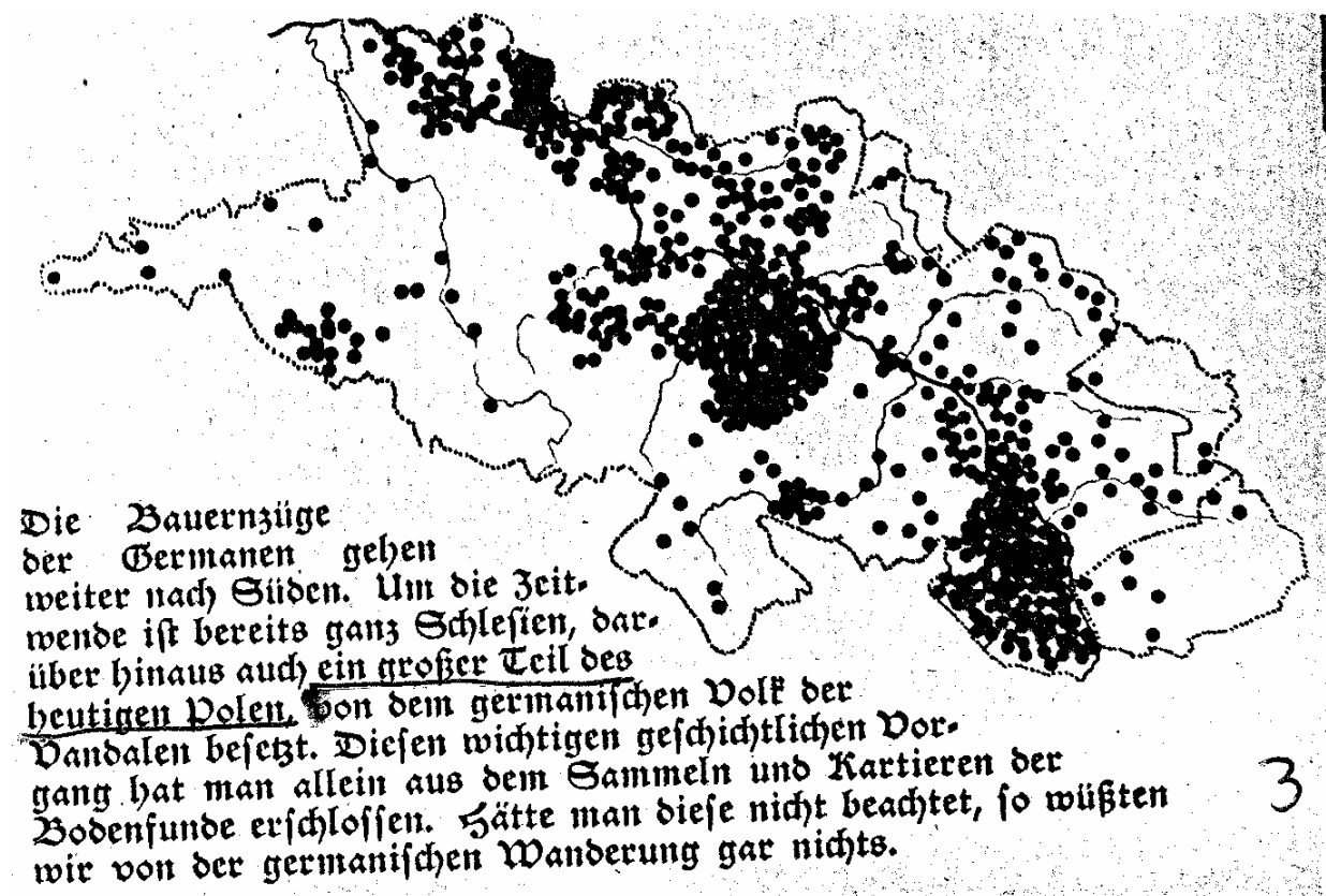
Abb. 7: Stumme Karte: „Die Bauernzüge der Germanen gehen weiter nach Süden. Um die Zeitwende ist bereits ganz Schlesien, darüber hinaus auch ein großer Teil des heutigen Polen von dem germanischen Volk der Vandalen besetzt. Diesen wichtigen geschichtlichen Vorgang hat man allein aus dem Sammeln und Kartieren der Bodenfunde erschlossen. Hätte man diese nicht beachtet, so wüßten wir von der germanischen Wanderung gar nichts.“ (Buttler 1937, 36)

Entseelung des Fundstoffes (Wahle 1952,140)